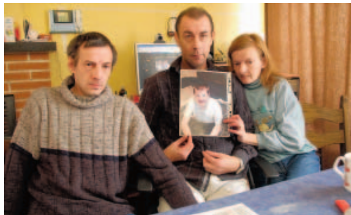
La famille de Kevin demande des peines plus lourdes. ■ M. CRAHAY

"Ce qui est terrible, c'est que, dans quelques années, le chauffard sera de nouveau en liberté et qu'il pourra recommencer. Même s'il n'a plus son permis, est-ce que l'empêchera de reconduire une voiture?", s'interrogent les parents de Kevin qui se souviennent à quel point leur enfant était merveilleux. "Il faisait des études de cuisine et était toujours très fier de nous mon-